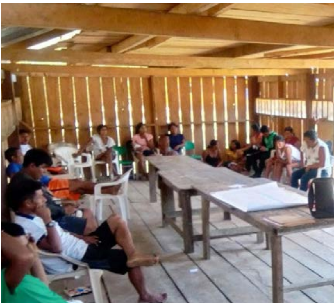
educación local.

enseña en un aula sino en el cuerpo». Se generaron dos documentos clave contruidos colectivamente y ratificados por el Consejo Indígena del Yaigojé Apaporis (CI-TYA):