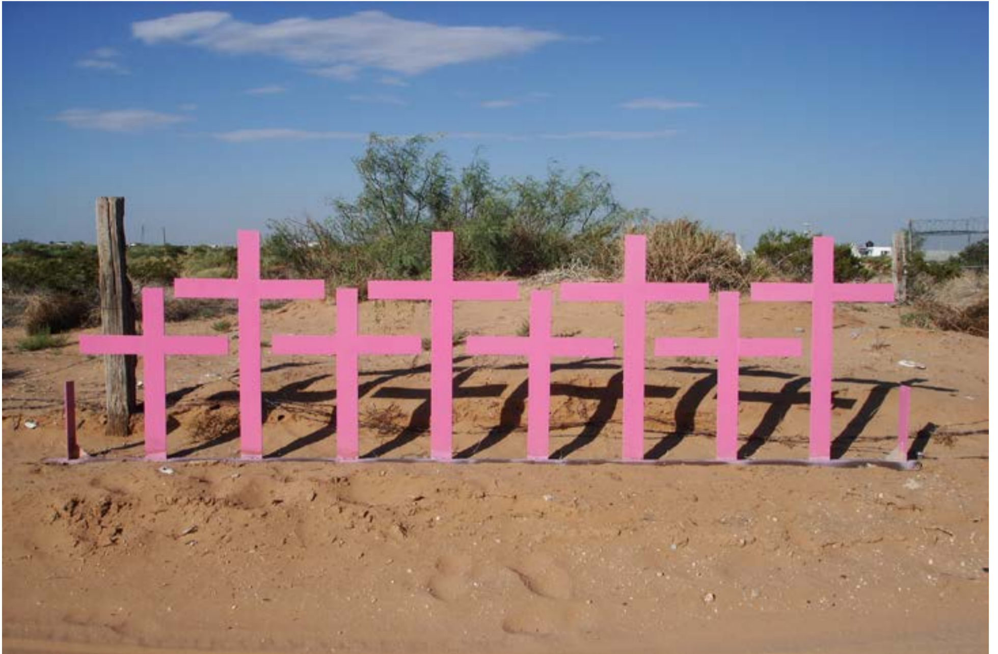
Cruces en Lomas del Poleo Ciudad Juárez, México) en el lugar donde fueron encontrados 8 cadáveres de mujeres en 1996.

C ifras oficiales de la Secretaría Distrital de la Mujer, compiladas a partir de datos del Instituto Nacional de Medicina Legal y Ciencias Forenses y divulgadas por la Bancada del Partido Político MIRA en el Concejo de Bogotá, arrojan un panorama alarmante sobre la violencia de género en la capital. Entre 2020 y agosto de 2025, un total de 11.534 mujeres han sido identificadas en situación de riesgo de feminicidio con seguimiento institucional.