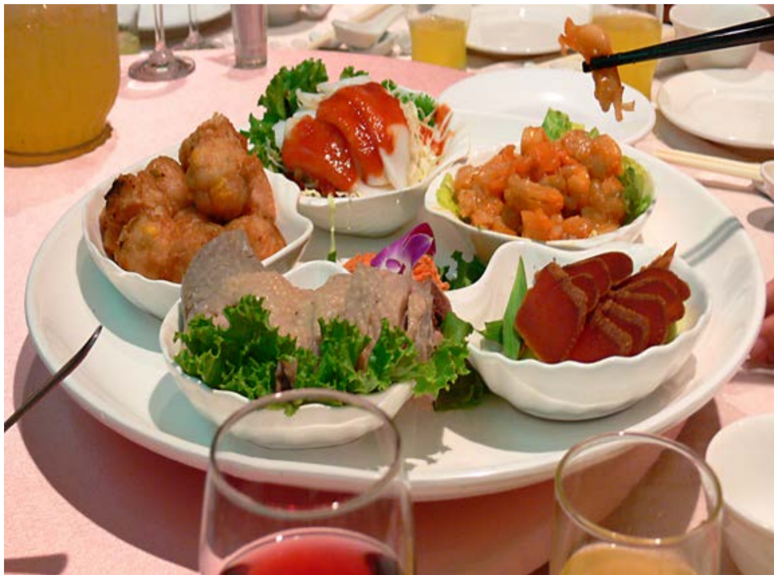
Comida taiwanesa servida en una boda.

Al ser Taiwán una isla, el pescado es abundante. Por eso lo más típico de Taiwán son los mariscos. También el arroz, cocido, en sopa, o gachas, es muy típico acompañando a tapas de verduras o frutos secos. Lo típico de la comida actual de Taiwán está en su modo de cocinar. Los sabores son más bien suaves, con muchos platos agrídulces. Todos los tipos de cocina, como