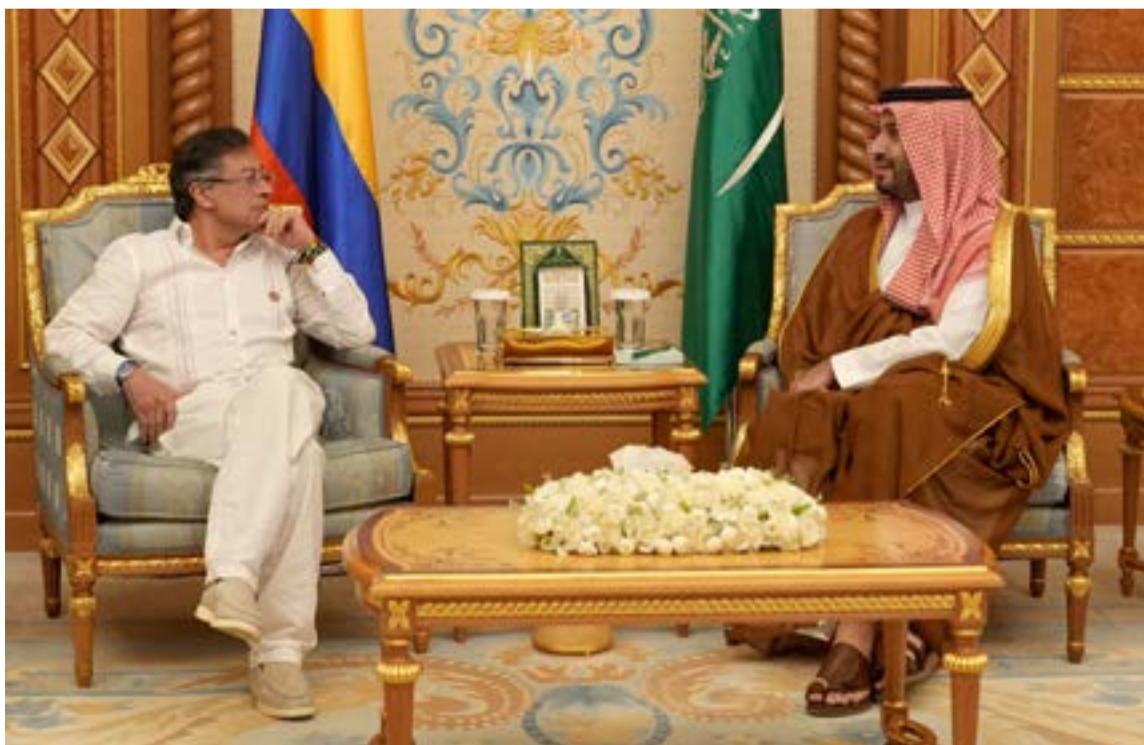
El príncipe heredero de Arabia Saudita, Mohamed bin, recibió al presidente de Colombia, Gustavo Petro Urrego como huésped de honor durante su presencia en ese país.

La apertura en Riad consolida el impulso del gobierno de Petro de expandir su presencia diplomática, que ha incluido la apertura de nuevas embajadas como parte de un esfuerzo por tener representación activa en los cinco continentes y asegurar que la voz de Colombia sea escuchada en foros globales clave.