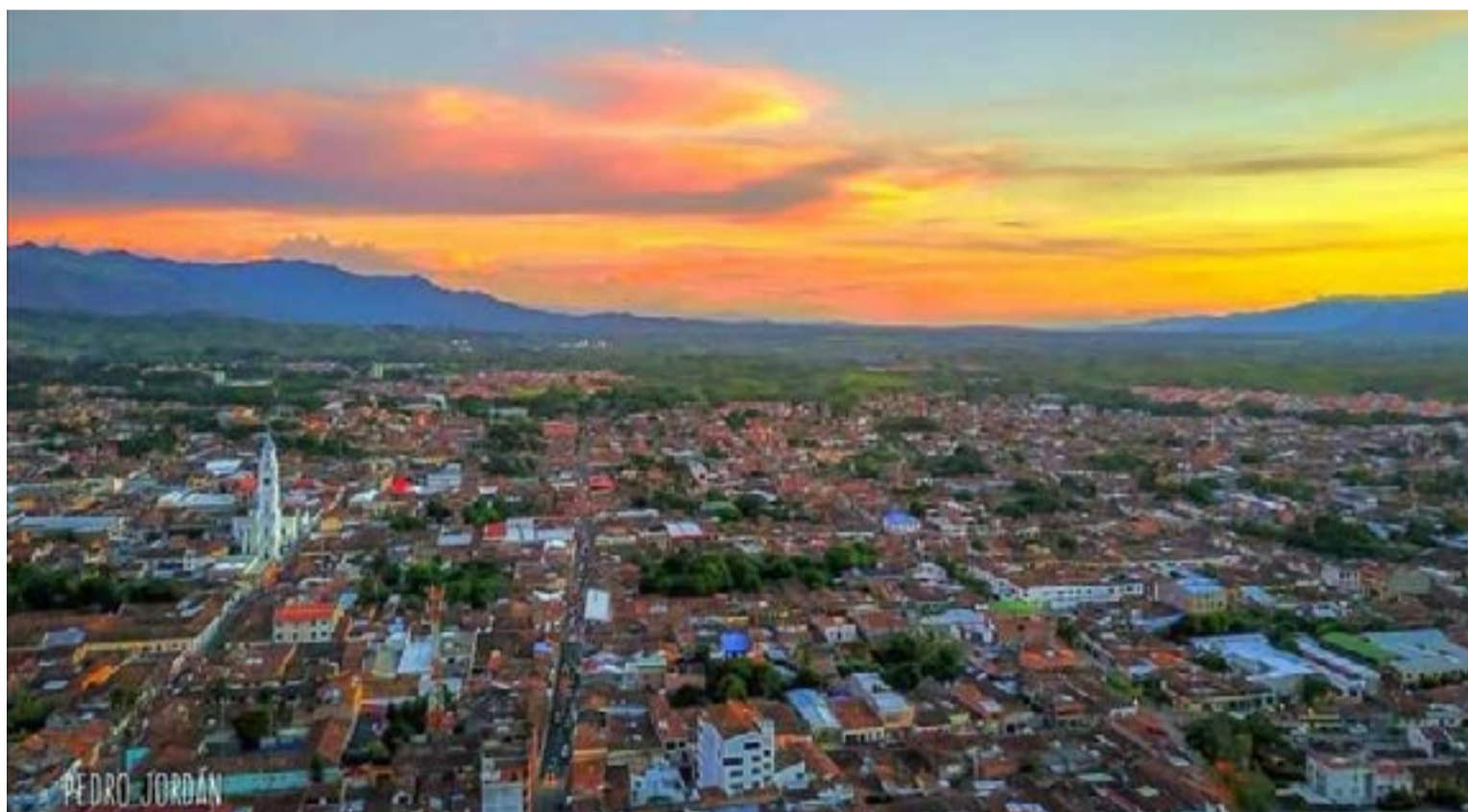
Cartago Valle del Cauca

Probablemente por ese olvido histórico o porque la civilización paisa borró el recuerdo y hasta lo rebautizó como el volcán del Ruiz pudieron haberse cometido las irresponsabilidades en Armero y Manizales que narro novelísticamente en la metáfora de los sordos que no oyeron las advertencias y hoy no hablan.