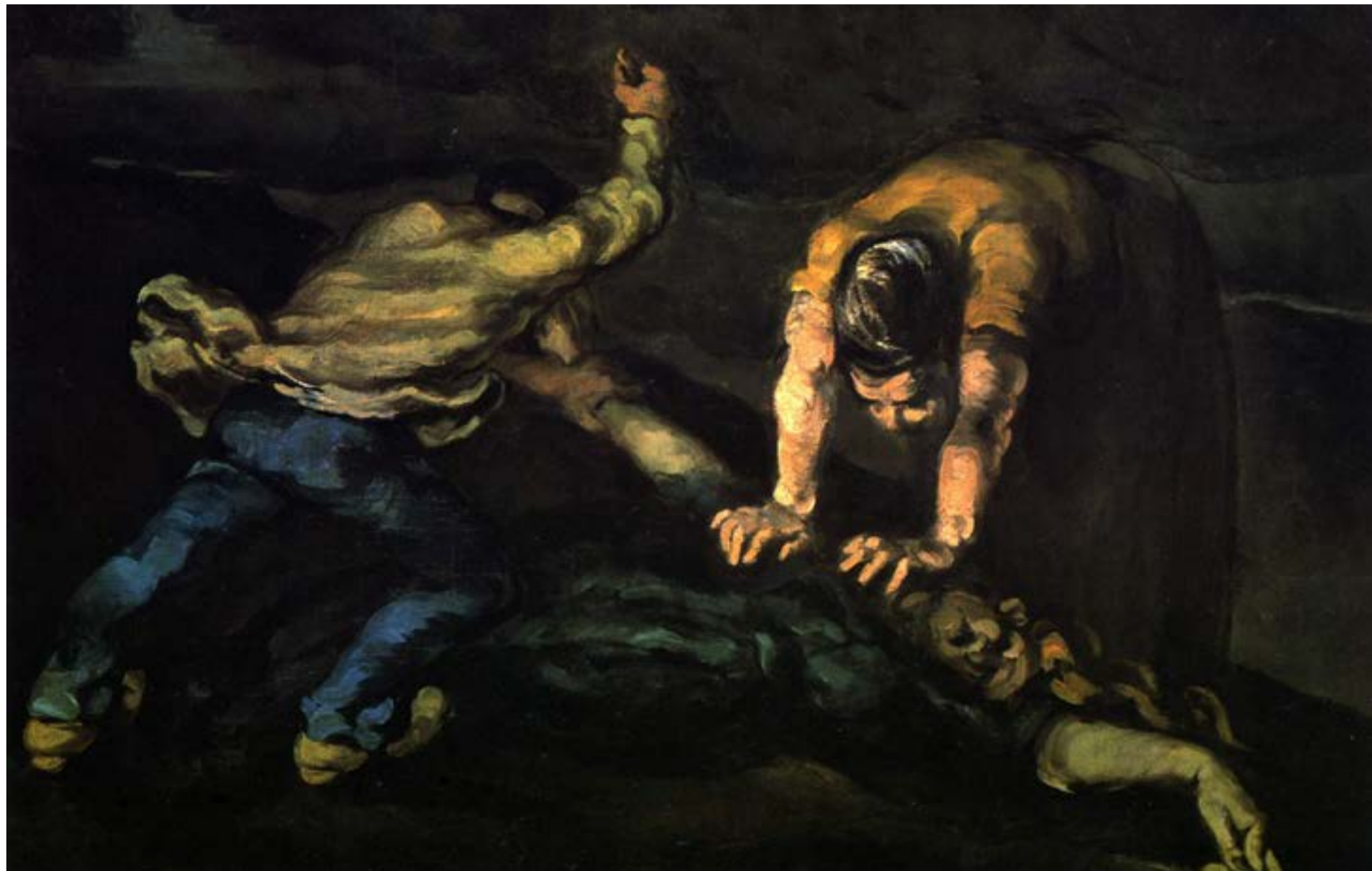
El asesinato, h. 1870