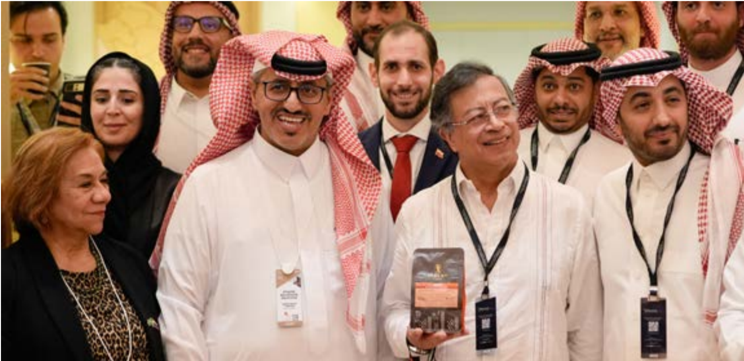
Empresarios de Arabia Saudita interesados en invertir en Colombia en respuesta a las gestiones del presidente Petro.