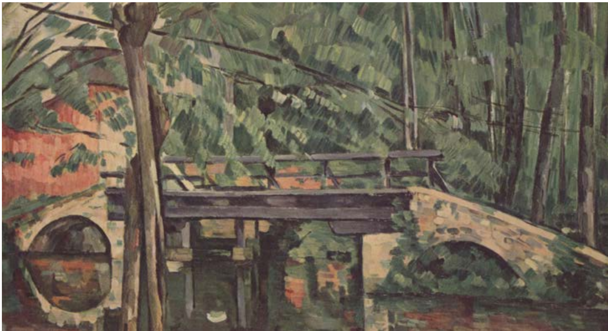
El puente de Maincy, 1879-1880

Con el tiempo, Louis Auguste decidió comprar el único banco que existía en Aix-des-Provence. Lo dirigió con disciplina. Los Cézanne se hicieron ricos como banqueros y las ganancias llegaron a borbotones. La plata que Paul recibía de su padre, ascendió a 125 francos mensuales. Ya no tenía que preocuparse por los gastos, los costos y las deudas futuras. Era una fortuna que bajaba del cielo.