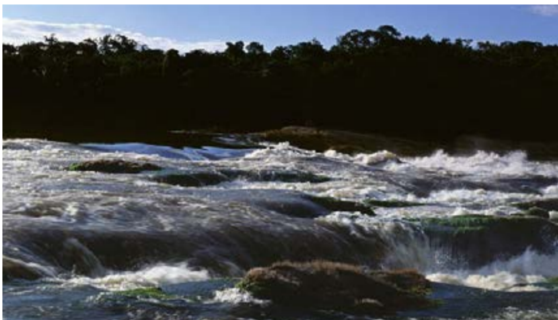
Rápidos del río Apaporis, afluente del Amazonas que recorre una de las zonas con mayor biodiversidad y riqueza cultural del país.

El proceso incluyó cartografías participativas y la vivencia en ceremonias tradicionales (como el baile del chontaduro), donde el investigador comprendió que la «educación ambiental no se