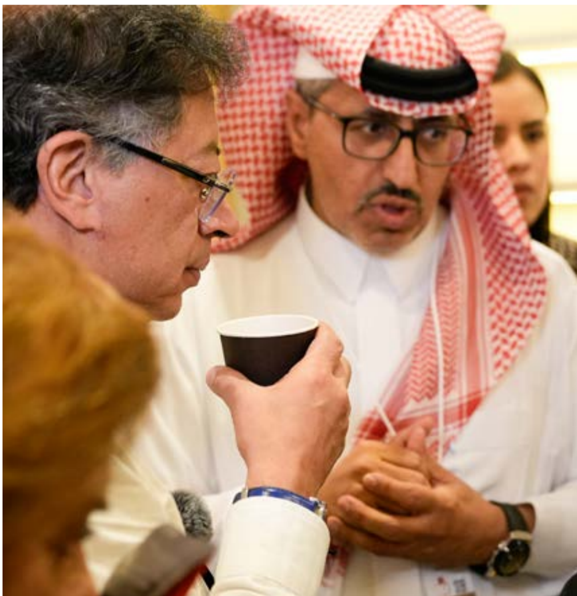
Colombia y Arabia Saudita acordaron acciones conjuntas en la hermandad de los dos países.

La Cancillería colombiana ha confirmado que