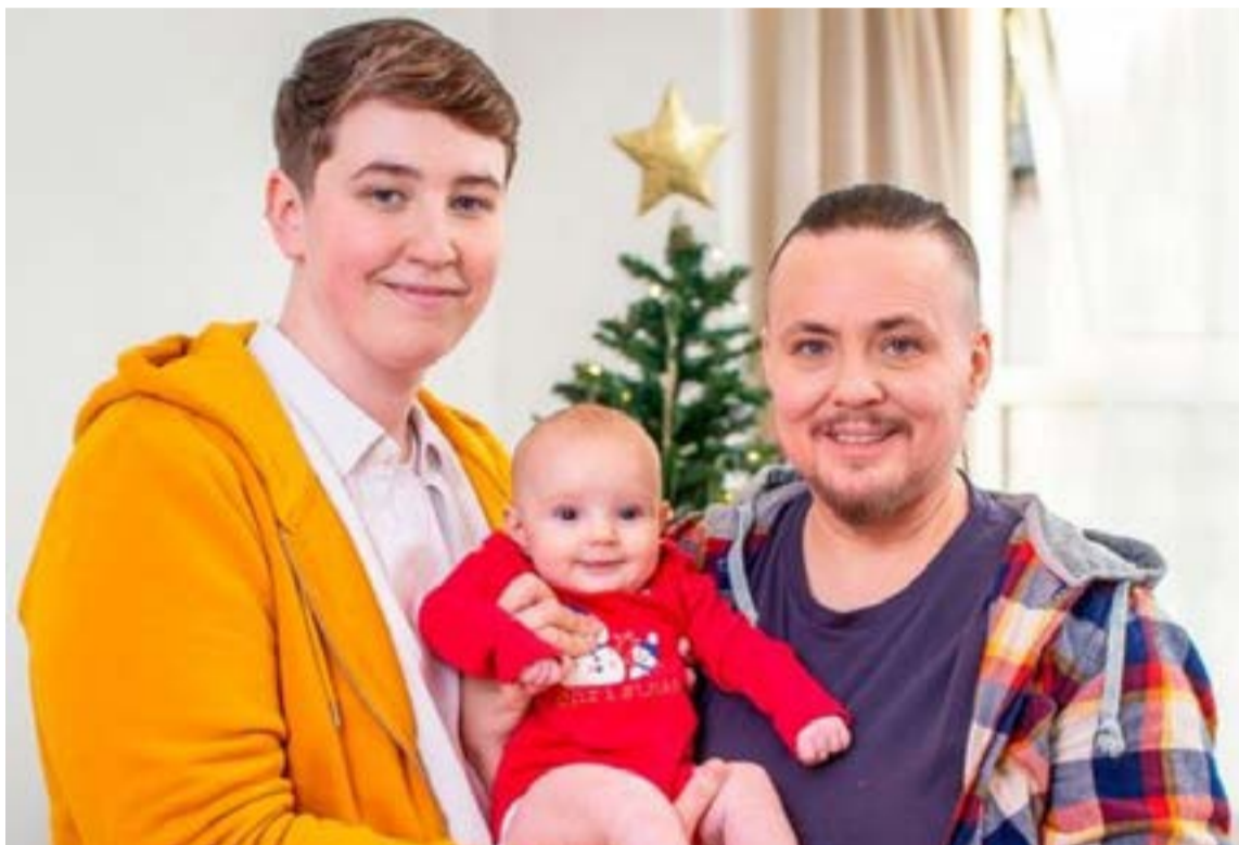
Visibilidad de la diversidad sexual

En primer lugar, es importante entender a qué hacen referencia ambos términos. Una persona no binaria, es aquella que no se considera exclusivamente del género femenino o masculino. Por otro lado, el término hombre trans es utilizado para referirse a las personas que fueron asignadas al género femenino al nacer, pero que poseen una identidad de género masculina. Como consecuencia de la invisibilización de las personas no binarias y hombres trans, el 24 de agosto de 2023, la Corte Constitucional emitió la sentencia C-324 donde se consideró que existía una discriminación estructural hacia ambas identidades de género.