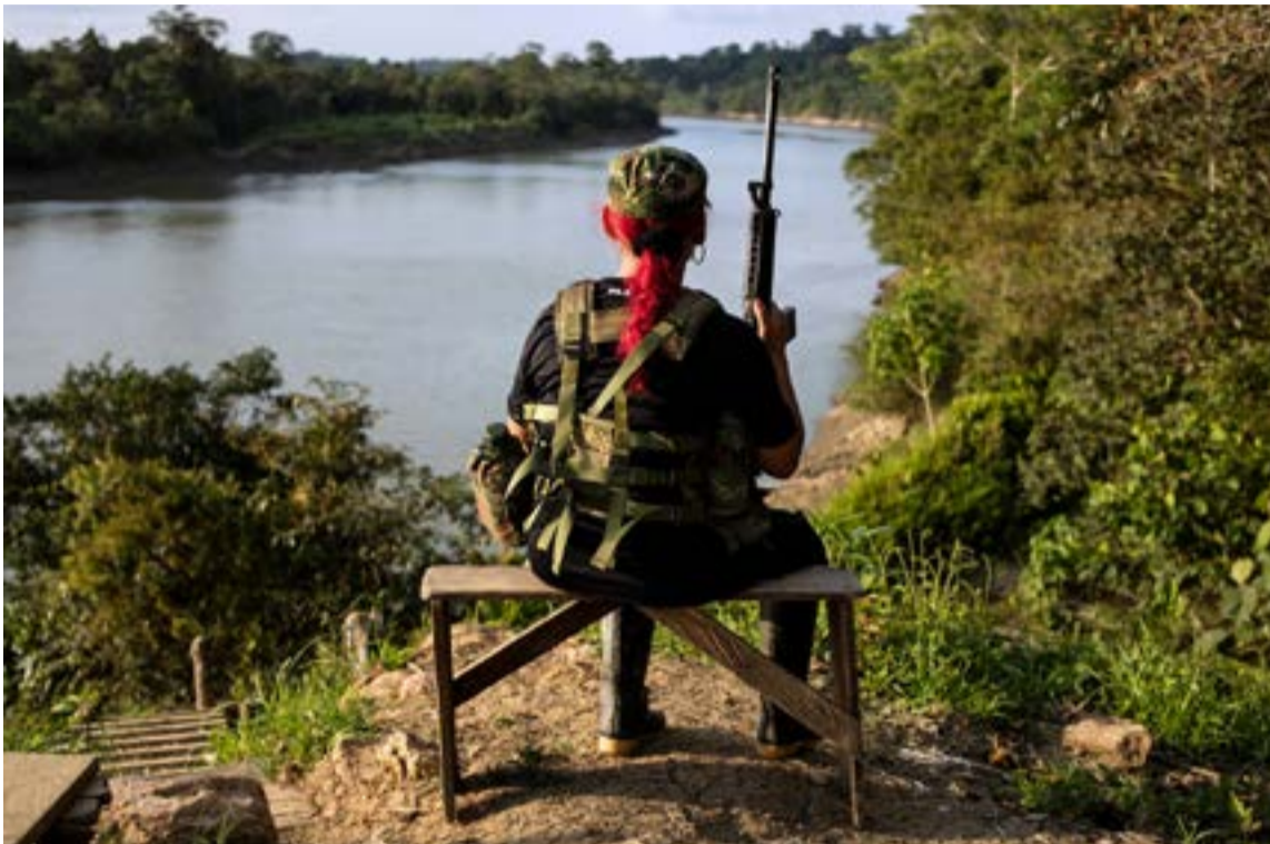
La pobreza y la guerrilla en el Pacífico colombiano

El acceso al mar convierte a Chocó y el Valle del Cauca (especialmente Buenaventura) en corredores vitales para el tráfico de drogas y armas: