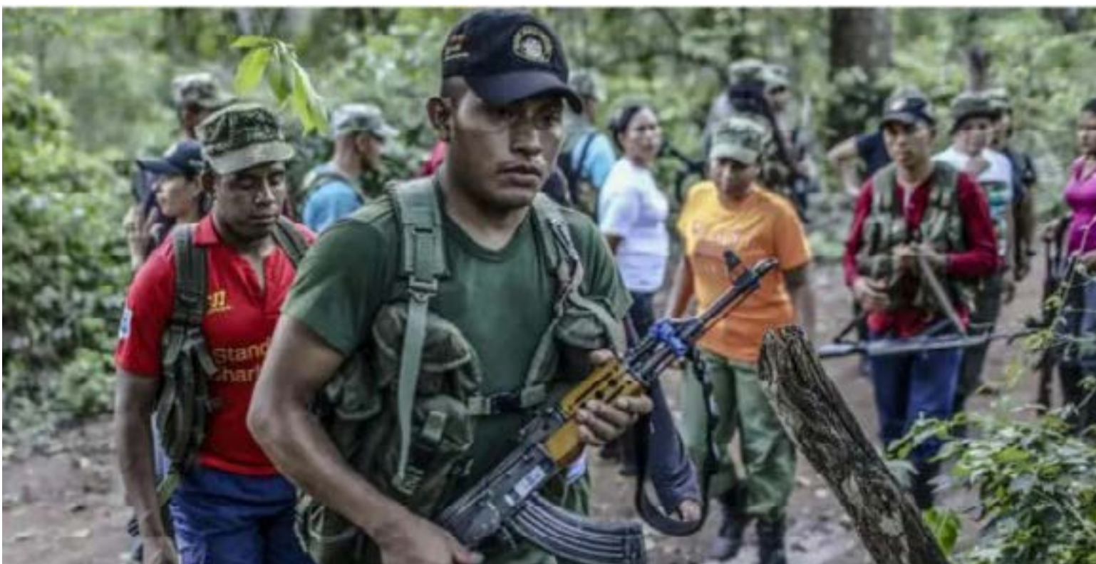
Toda clase de grupos de derecha y de izquierda además de narcotraficantes operan en el pacífico colombiano.

Las autoridades alertan que esta compleja red de colaboración entre GAOs (EMC, Segunda Marquetalia, ELN y Clan del Golfo) ha incrementado el riesgo humanitario y la dificultad de las operaciones de la Fuerza Pública en todo el país.