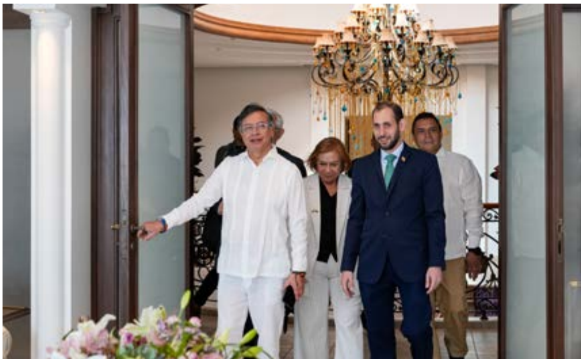
El presidente de los colombianos, Gustavo Petro Urrego, dió al servicio la nueva Embajada de Colombia en Arabia Saudita.

La principal motivación, según las declaraciones de Petro, es la necesidad de que Colombia «no se bloquee, se abre a todo el mundo». El mandatario busca diversificar los socios económicos y políticos más allá de los ejes tradicionales, como Estados Unidos y Europa.