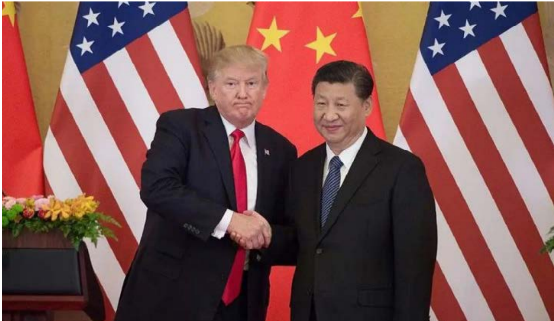
Xi Jinping y Donald Trump , presidentes de China y Estados Unidos pactaron una tregua comercial.